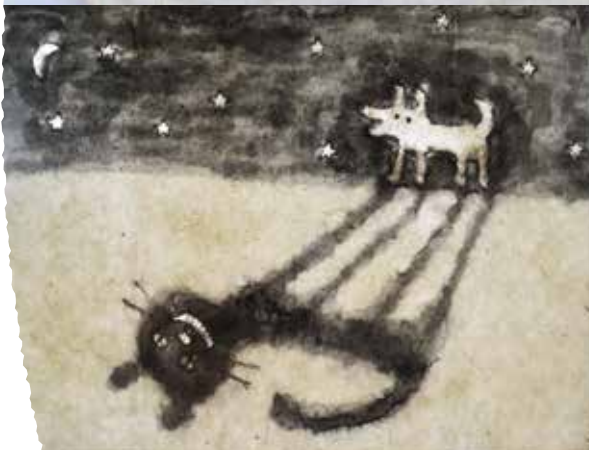
『夏』 『Cat or dog.』